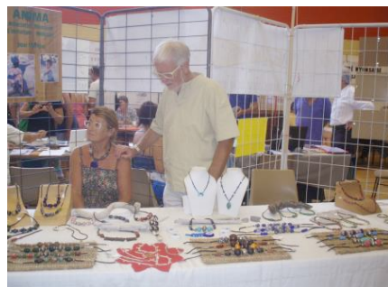
Rédaction : Yves Meng Maquette et mise en page : Philippe Ador

L'atelier « Laines et Colliers », création de Lyliane, sera à nouveau présent pour les fêtes de fin d'année à la salle Roumanille à Nyons, du samedi 23 décembre 2017 au lundi 1 er janvier 2018 de 14 heures à 18 heures tous les jours, sauf le 25 décembre. Ouvert de plus le jeudi 28 décembre de 9h à midi. Les revenus de l'Atelier nous permettent d'offrir une bourse aux étudiants pour leur formation de soignant.