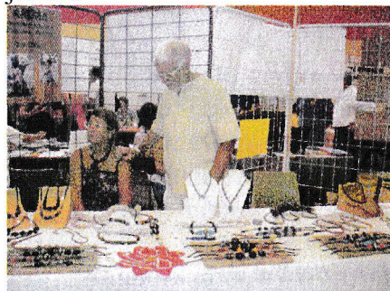
Rédaction : Yves Menguy Maquette et mise en page : Philippe Ador

Nous venons d'exposer à Nyons à la fête des « Olivades » à la mi-juillet.