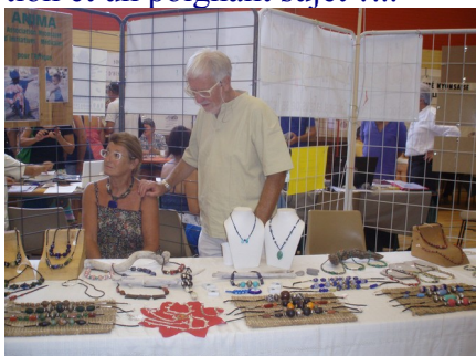
Rédaction : Yves Menguy Maquette et mise en page : Philippe Ador