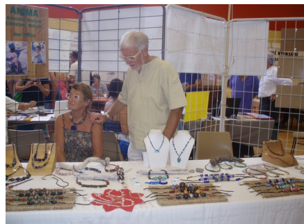
Rédaction : Yves Menguy Maquette et mise en page : Philippe Ador