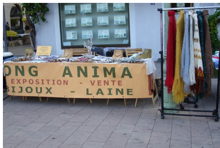
Rédaction : Yves Menguy Maquette et mise en page : Philippe Ador